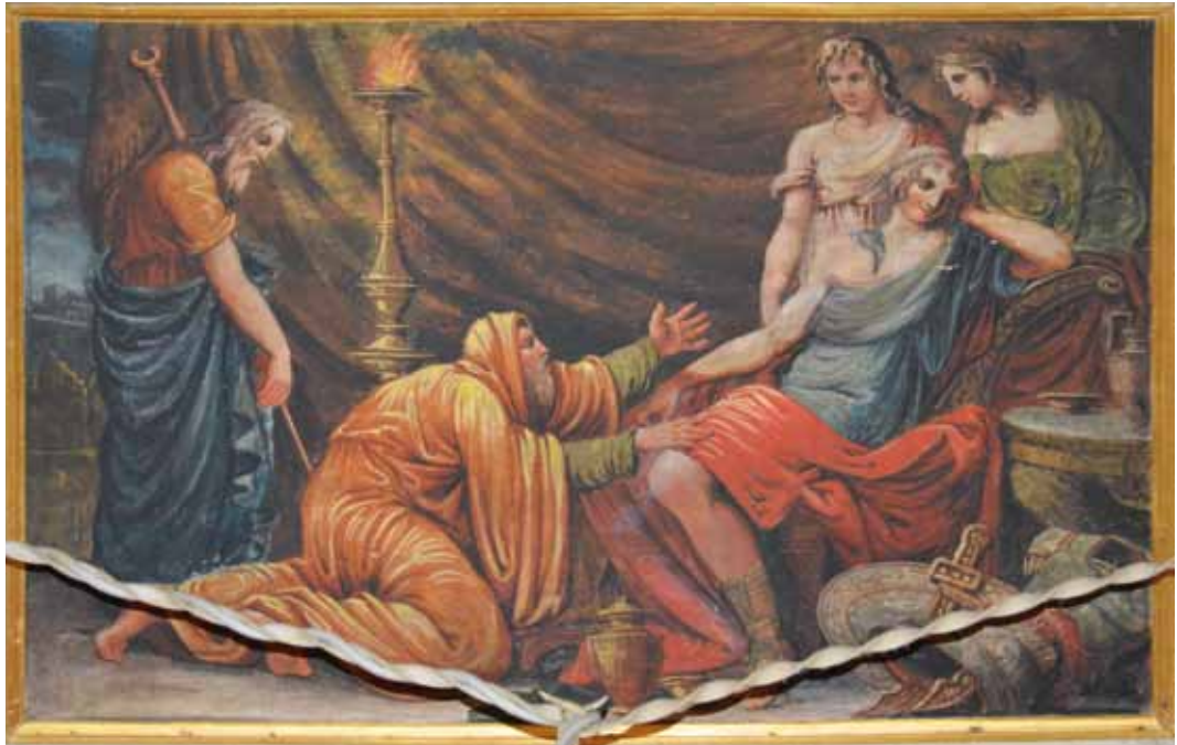
D. Gallamini, Priamo chiede la restituzione del corpo di Ettore