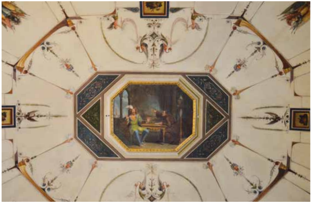
G. Mattioli, Colloquio tra Galeotto Manfredi e Frate Silvestro