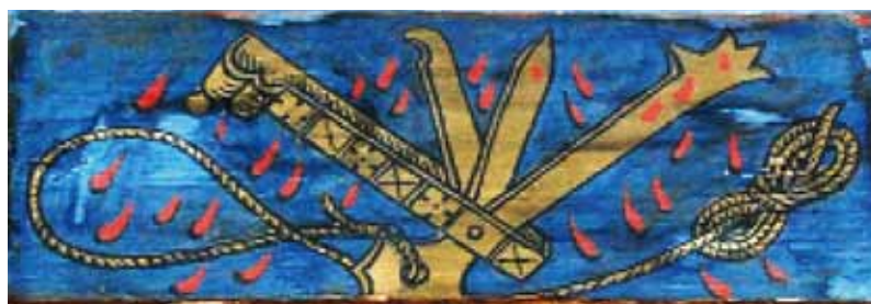
Sala Viride - particolare di imprese e stemmi manfrediani

GIAN MARCELLO VALGIMIGLI, Dei pittori e degli artisti faentini de' secoli XV e XVI , Faenza, Tipografia di Pietro Conti, 1871.