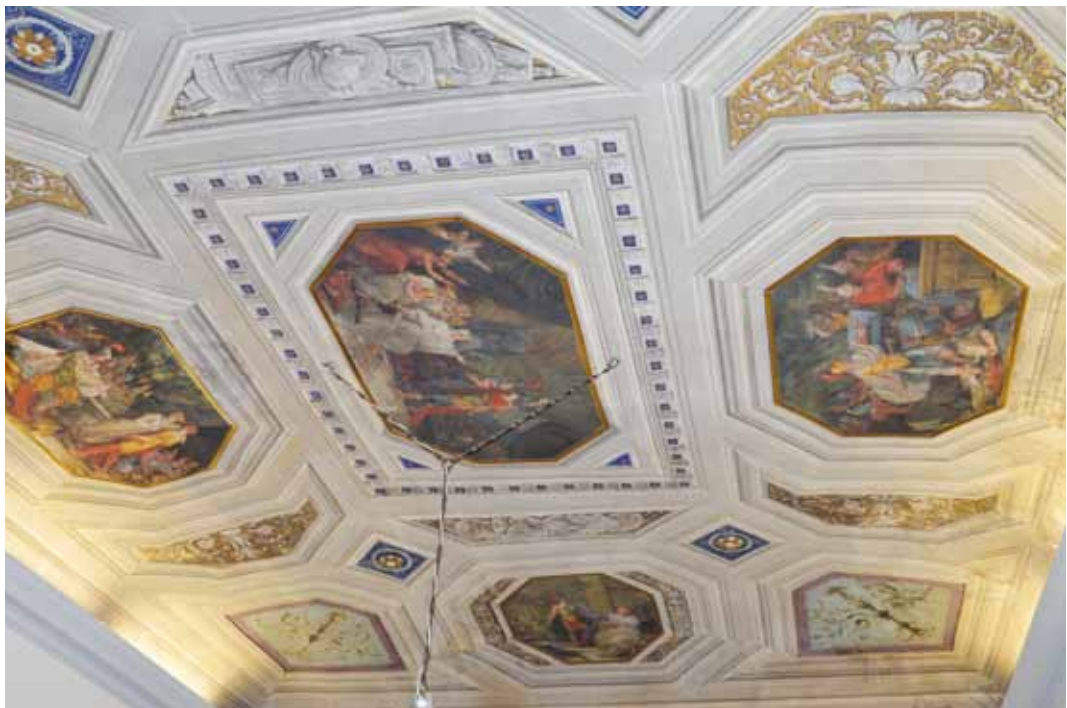
D. Gallamini, Decorazione della volta della Sala di Alessandro