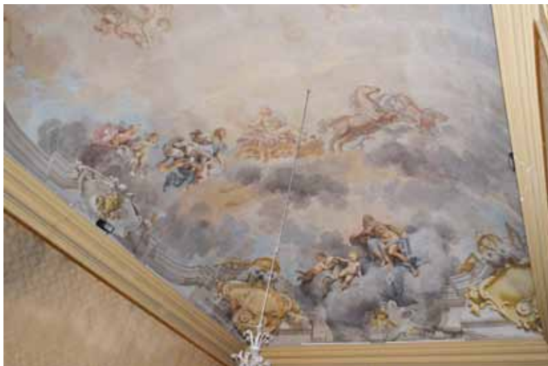
V.M. Bigari, S. Orlandi, decorazioni della volta della Sala del sole

7 La commissione del 1556 del cardinal Carafa al pittore faentino è riferita dal Tonducci che precisa essere avvenuta dopo la visita alle mura della città. L'episodio non ha tradizioni iconografica ed è stato identificato grazie a un appunto del Mattioli (BCFo, Carte Romagna, 285.30-55, Appunti per le composizioni pittoriche ) "D. Antonio Carafa ordina che faccia la pianta della Città di Faenza Giacomo Bertucci".