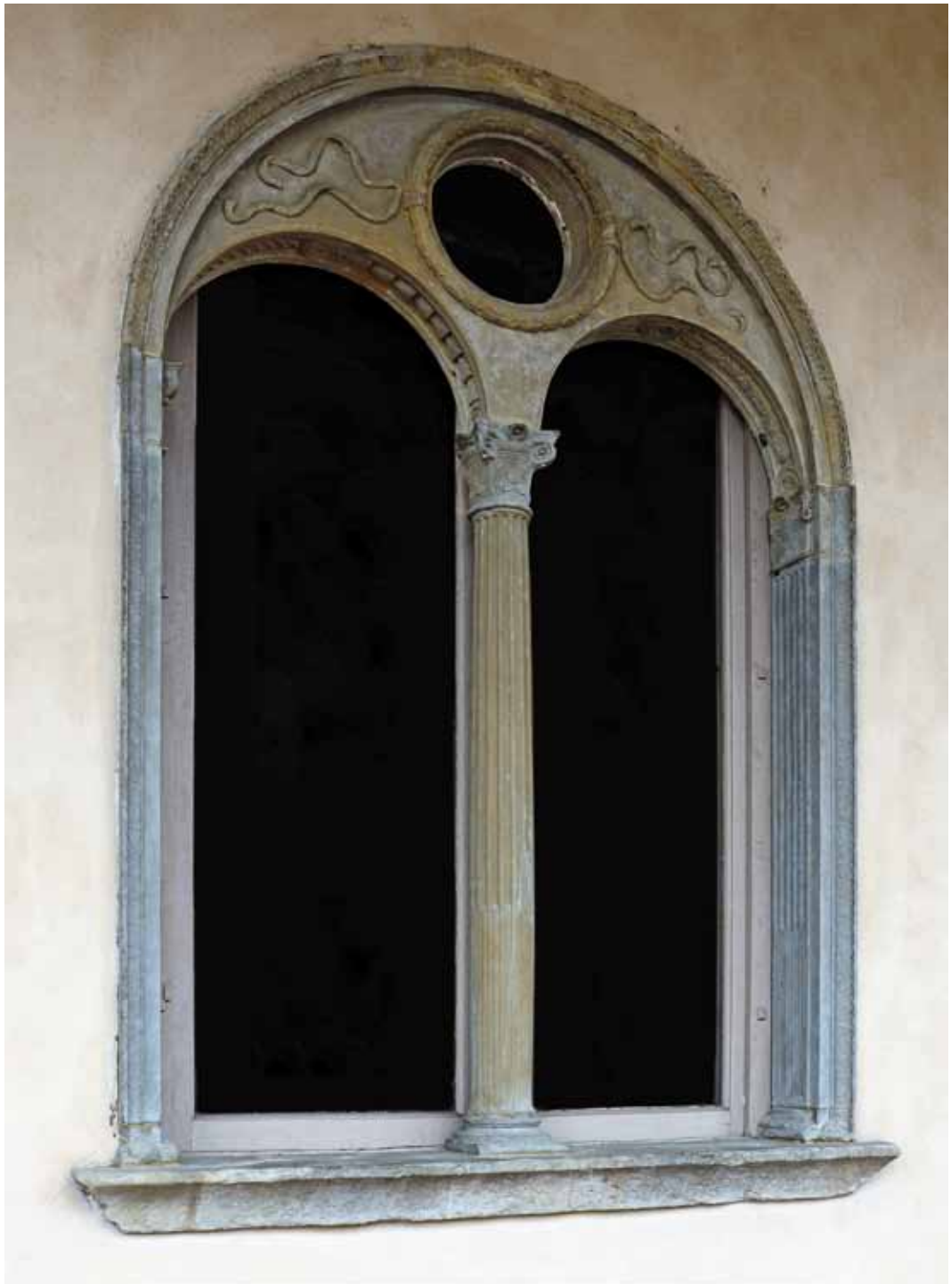
Bifora in pietra serena di età manfrediana