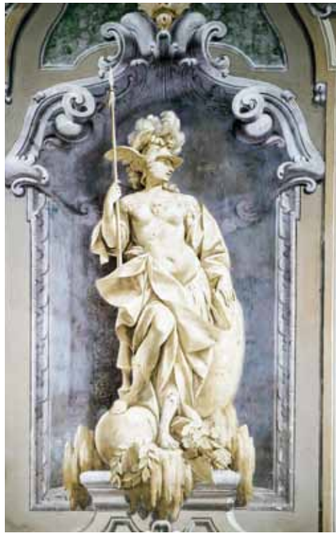
V.M. Bigari, S. Orlandi, decorazioni della Galleria : a - Roma b - Tevere