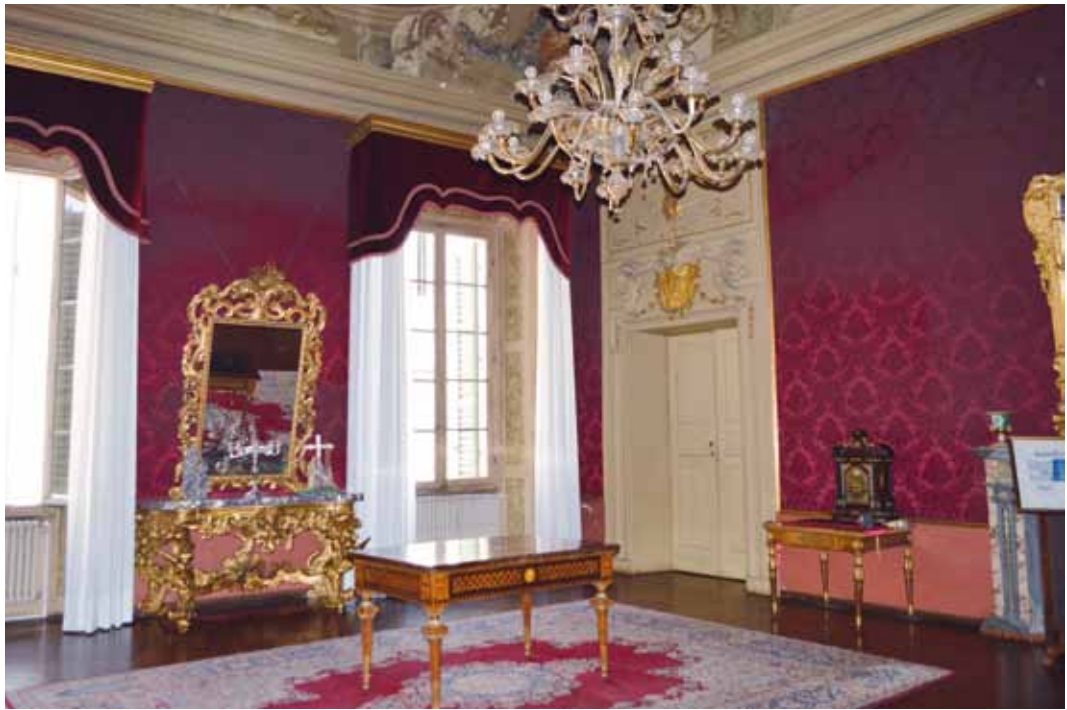
Sala delle rose