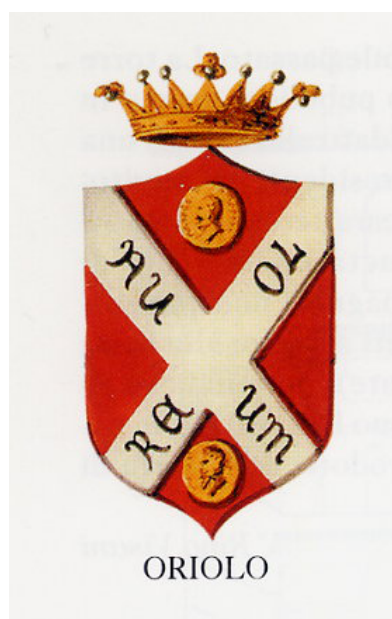
Lo stemma del Castello di Oriolo, versione moderna.