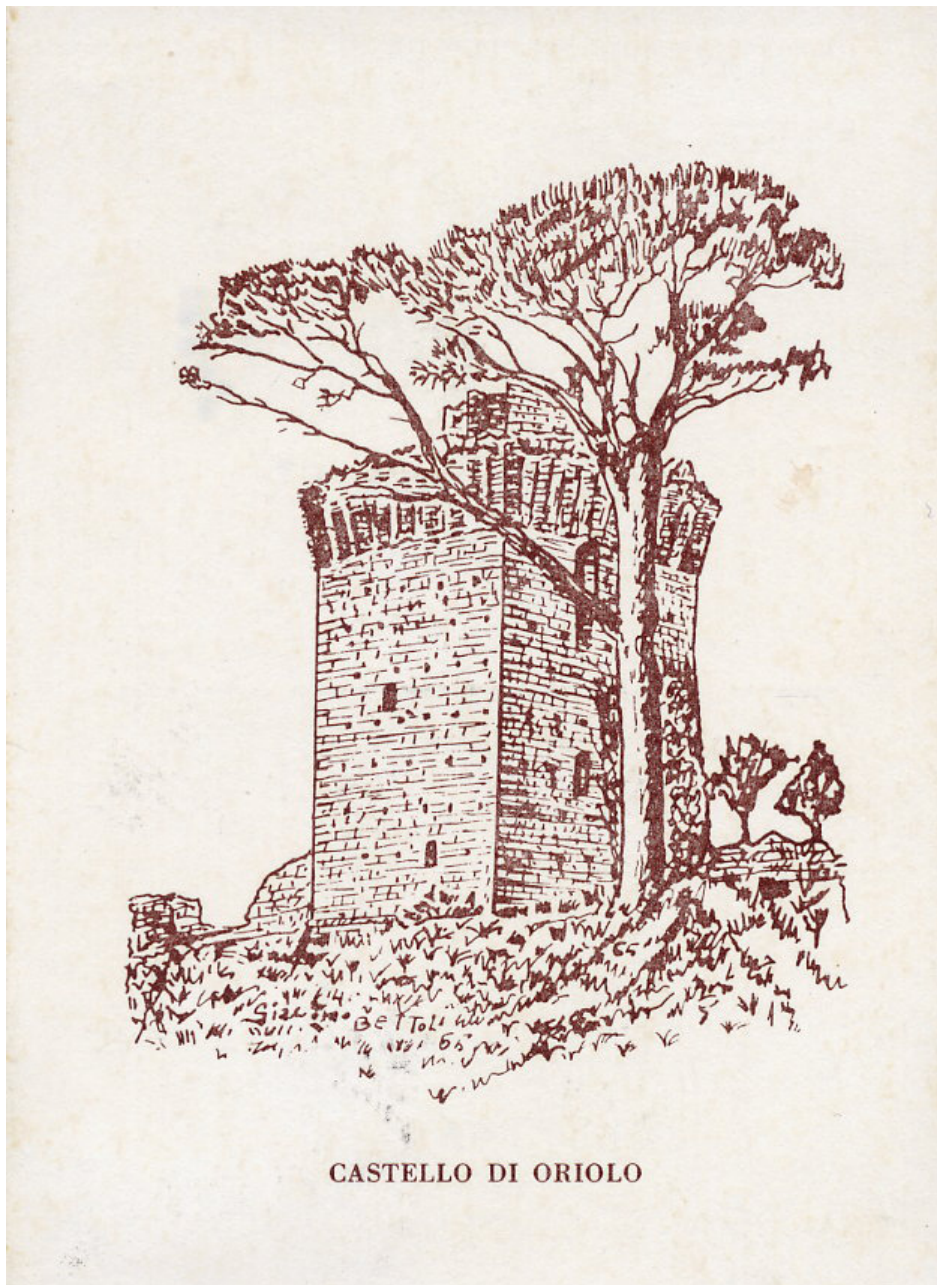
CASTELLO DI ORIOLO

"La visita di un rudere ci porta sempre a visioni di tempi lontani. Ecco perché ci è grato talvolta soffermarci davanti ad una rozza pietra, d'accanto ad una cadente bertesca. Nido di fantasmi, culla di pensieri inutili e di idee sterili sia pure, ma che hanno la grande virtù del fascino e del sogno. "